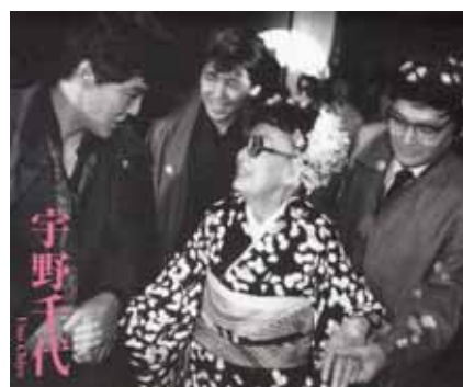
宇野千代88歳、米寿の会(1985年) 「中央公論」2008年4月号より