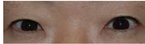
< 術後 >

目袋とは眼瞼の皮膚とそのすぐ下にある筋肉（眼輪筋）がゆるんだ結果であり、症例によっては眼瞼の赤い粘膜が外側を向いてしまう（眼瞼外反）状態になることがあります。手術は皮膚と筋肉の緊張を再建することになりますが、これによって完全に取れないこともあり、またかえって一時的に外反を増強させてしまうこともあります。