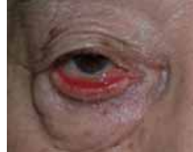
< 眼瞼外反術前 >