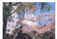
札幌時代(大正9~11年) 共同文化社 神蓑努著「女流作家の誕生 宇野千代の札幌時代」より