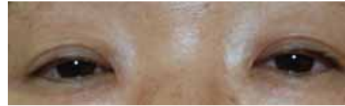
< 眼瞼下垂術前 >

眼瞼の弛みについてお悩みの方で、特に中高年では大抵眼瞼挙筋の筋力低下や機能不全を伴い、眼瞼下垂の状態になっていることがあります。この場合は皮膚の弛みを取るだけでなく、筋肉にも手術操作を加えなければすっきりと眼瞼を開けることができません。眼瞼下垂の方で肩凝りや偏頭痛を訴える方が多のは、無意識のうちにあごを挙げて物を見ていたり、額から後頭部につながる筋肉を多用したりすることが原因しているともいわれています。