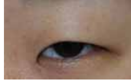
< 逆さまつげ術前 >