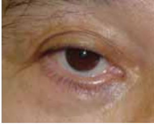
< やけどによるひきつれの術前 >