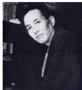
伊東の自宅書齋にて(昭和22年)

やがて馬込から1kmほどの距離にある大田区山王に引っ越し、1964年に亡くなっている。この晩年の住居は、大田区が買い取り、今年5月には「尾崎士郎記念館(仮称)」としてオープンの予定である。なお遺族は、馬込文士村のプレートなどのように、いつも士郎と宇野千代と一緒にされることに、いささか微妙な感情を覚えているそうである。