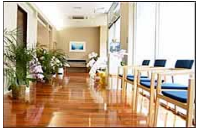
待合室 (エントランスゾーン)

1995年 東京慈恵会医科大学卒業 1995年～2006年 虎の門病院勤務 (現：虎の門病院非常勤外来勤務) 2006年4月 そめや内科クリニック開業