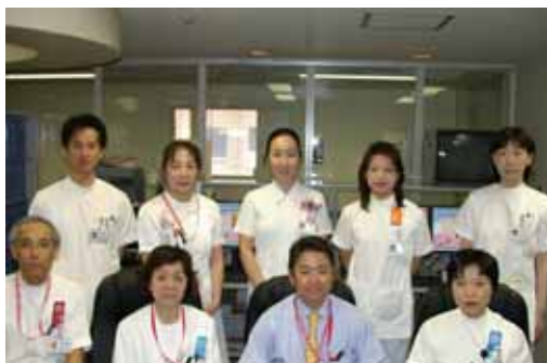
睡眠センタースタッフ