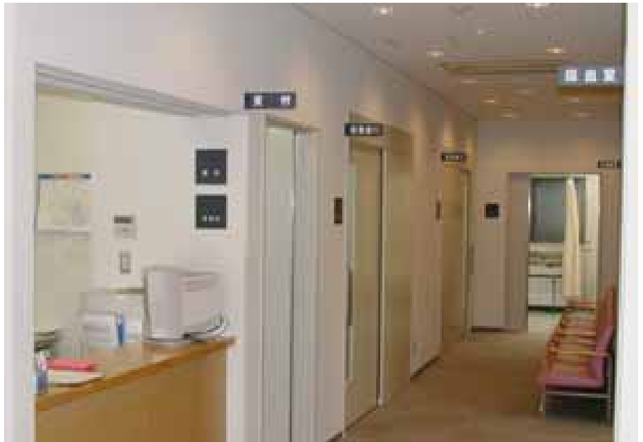
「さいたま診療所」 さいたま新都心 (平成12月6月開院)