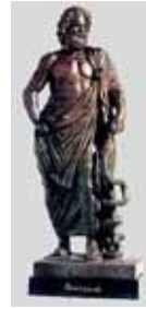
アスクレピオス像