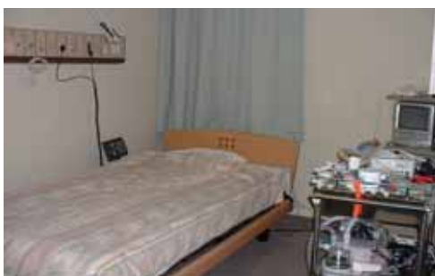
<睡眠センター検査室 全室個室>

虎の門病院では、初診時にSASが疑われたら、自宅で簡単に行なえる無呼吸モニターを行ないます。その結果、詳しい検査や治療が必要なら、睡眠中の状態を正確に知るために、「睡眠ポリグラフ検査」を行います。一般的には、一晚入院し、検査用の端子を体につけて就寝します。