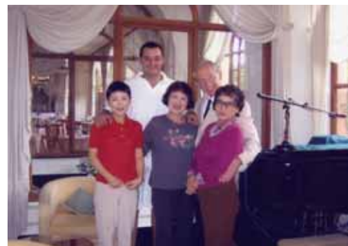
スプリンディッド・ホテルにて

果たせるかな、車に乗り込もうとしたとき、支配人は出てもこなかった。チップに満足なら、われわれを抱かんとばかりにして見送ったはずなのである。グラチエ3回の診断は正しかったでしょうと、私はみなに解説したのであった。