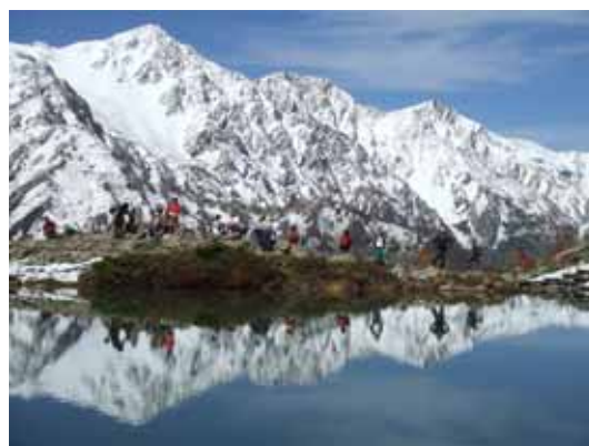
新雪の白馬三山と八方池